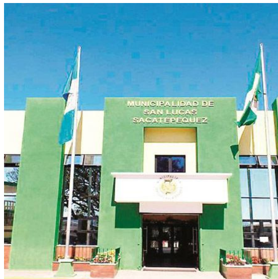
Municipalidad de San Lucas Sacatepéquez, Sacatepéquez